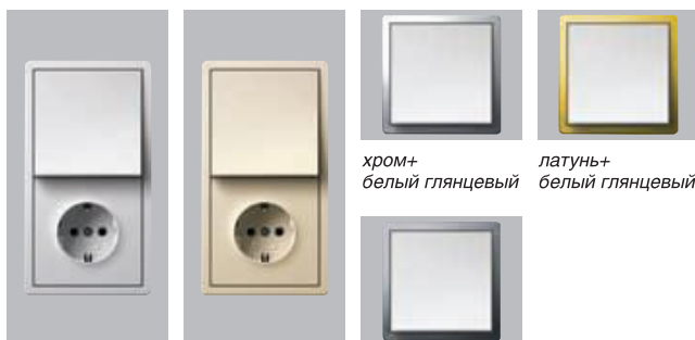
цвет рамки белый глянцевый